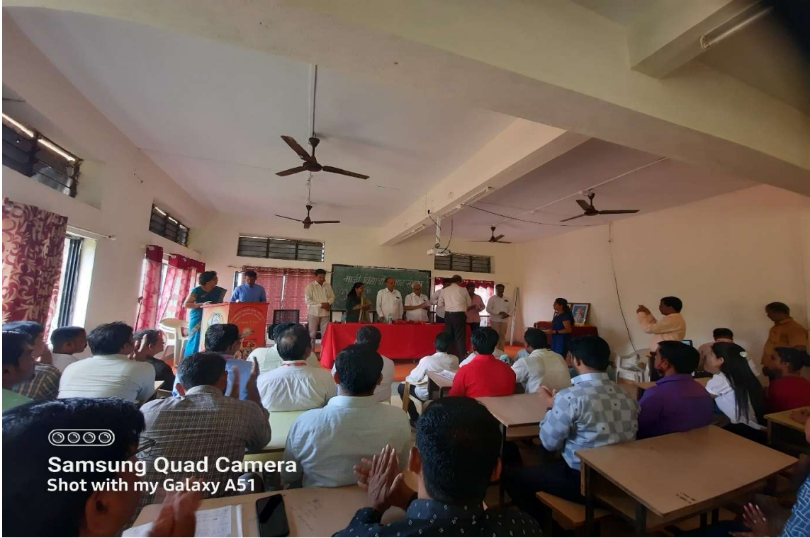
Samsung Quad Camera Shot with my Galaxy A51